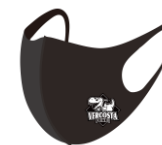
オリジナルマスク